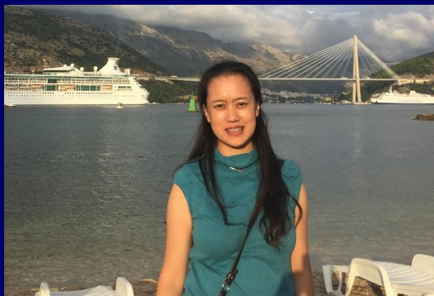
气候变化科学有关管理， IPCC工作的组织协调